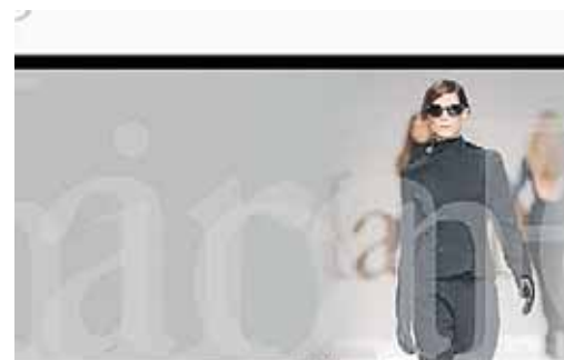
Il nuovo portale internet Max Mara Fashion Group

doppio rispetto al 2007), con svalutazioni per 2,6 milioni. La diminuzione di valore legata alla crisi finanziaria internazionale 'ha inciso in modo limitato - si legge nel bilancio - riguardando solo una piccola parte degli investimenti a breve della società' che prevalentemente si sono rivolti verso strumenti monetari a 60-90 giorni facilmente liquidabili e che comportano un grado di rischio molto limitato'.