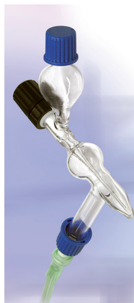
Gas Spray Gun